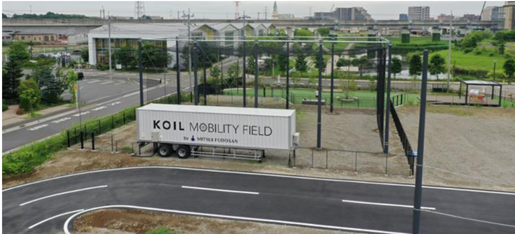
KOIL MOBILITY FIELDの様子

柏の葉賞エントリーへの応募に関しては、エントリーに関する提出物やプレゼンが日本語でも受け付けられます。(但し、日本語でエントリーした場合は「柏の葉賞」のみが受賞対象となります。AEA本大会へエントリーを希望する場合は提出物、プレゼン共に全て英語での実施が必要となります。)